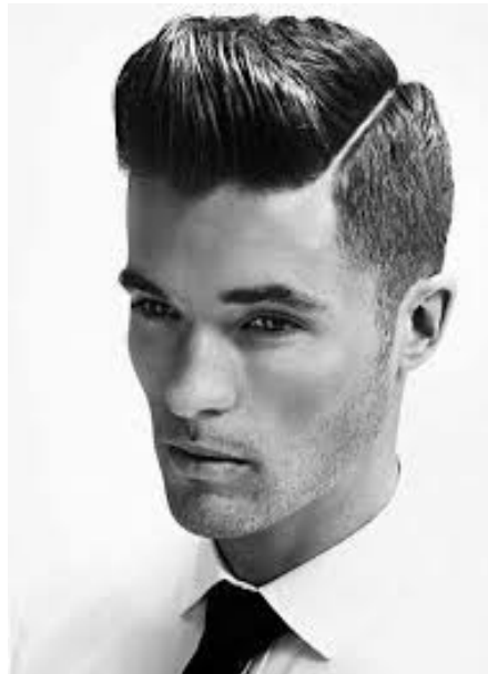
Formacion peluqueria caballeros

La academia de Formación de Peluquería de Caballeros está situada en Madrid, en el metro Parque de Santa Maria