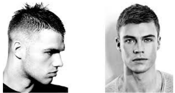
corte de pelo gratis todas las semanas

Corte de pelo gratis todas las semanas del año en el centro de Formación de Peluquería de Caballeros, que esta situado en el barrio de Hortaleza de Madrid.