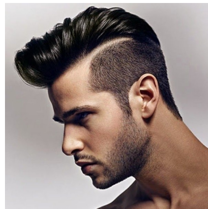
corte de pelo gratis para desempleados

En el centro de Formación de Peluquería de Caballeros si estas apuntado en el paro te realizamos un corte de pelo gratis para desempleados en la ciudad de Madrid, no sientas vergüenza en decir que estas desempleado y benefíciate de las ventajas de poder cortarte el pelo gratuitamente , ven a conocer tu academia de confianza, nuestros peluqueros te asesorarán y cuidarán tu imagen al máximo para que quedes completamente satisfecho con tu corte pelo gratis para desempleados. Si tienes alguna duda o pregunta a cerca del corte de pelo, de donde estamos o sobre alguna cuestion en concreto, puedes visitar la web www.formacionpeluqueriacaballeros.es en donde encontraras todas las respuestas a tus preguntas.